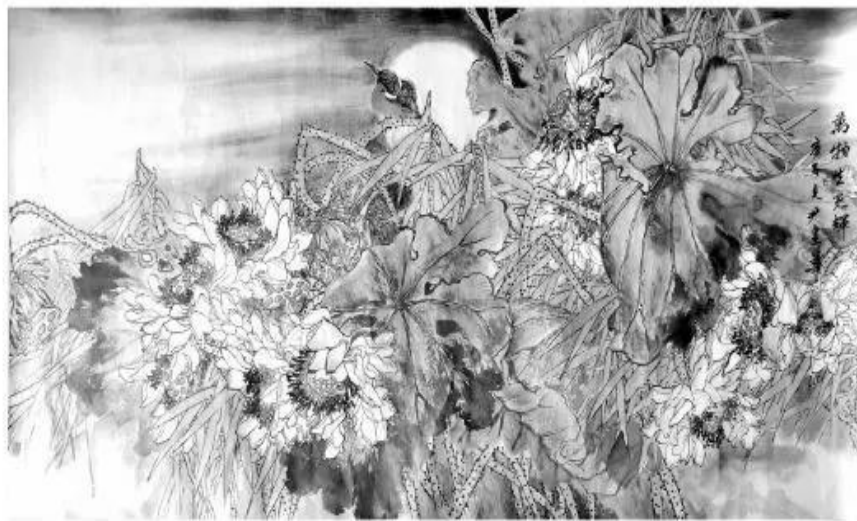
《万物生辉》 尹建华作

通俗的绘画语言,独特的艺术符号,温情的修养情感,奠定了建华在女性花鸟画方面的基础。“写胸中逸气,不奉迎世俗”,只要是对生活有感情的人,她的创作是永远也画不完的,艺无止境,在艺术的道路上,建华还非常年轻,绘画是一条艰辛的路,漫长的路,同时又是一条求得艺术精进的路,寄希望于斯! ●